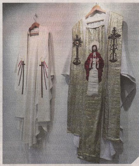
▲ Mėnuo – tiek laiko meistras užtrunka siuvinėdamas liturginį drabužį.

Nors vyras kiaušinius gravuoja neratodciniai būdu, tačiau tradicinių raštų savo darbuose nevengia.